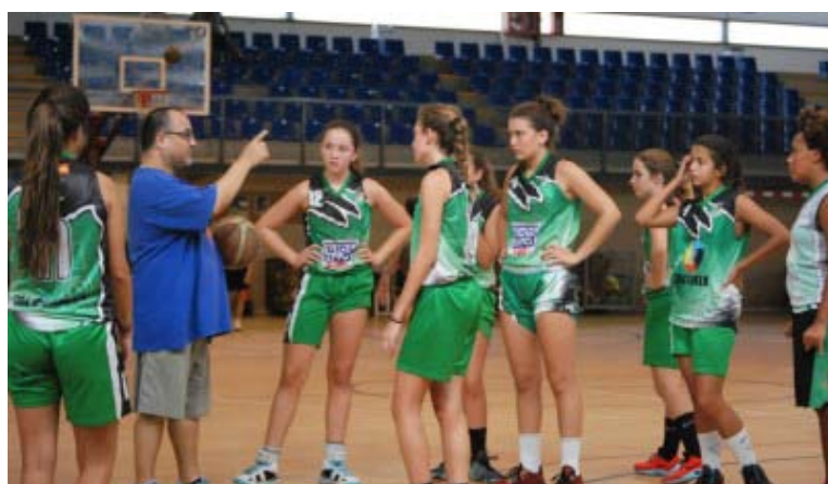
Amistosos Pretemporada CBI