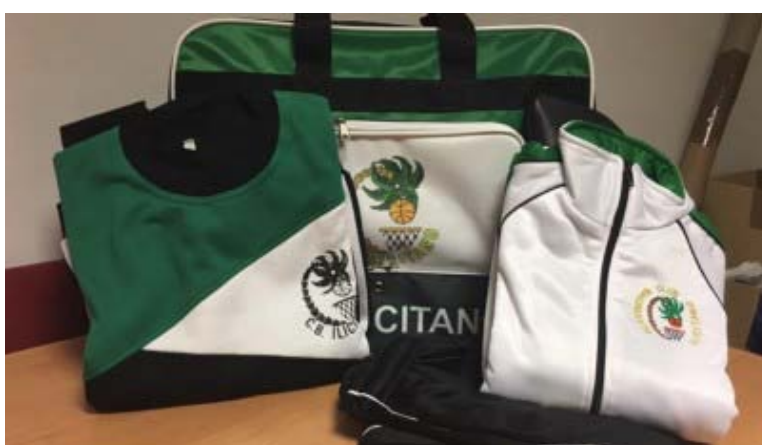
TIENDA CBI - Ropa y accesorios disponibles