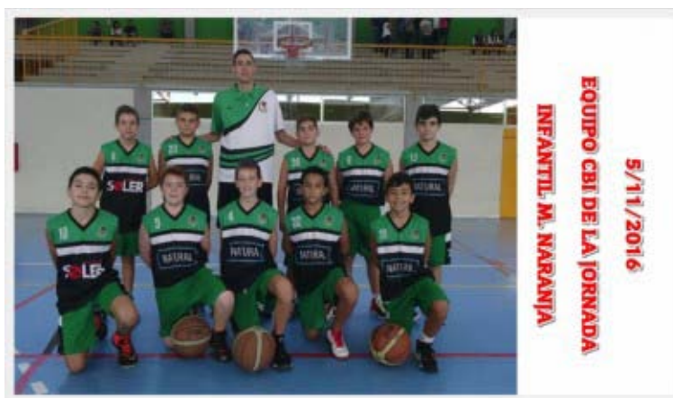
EI INFANTIL M. NARANJA NATURAL TELECOM N3 equipo CBI de la jornada