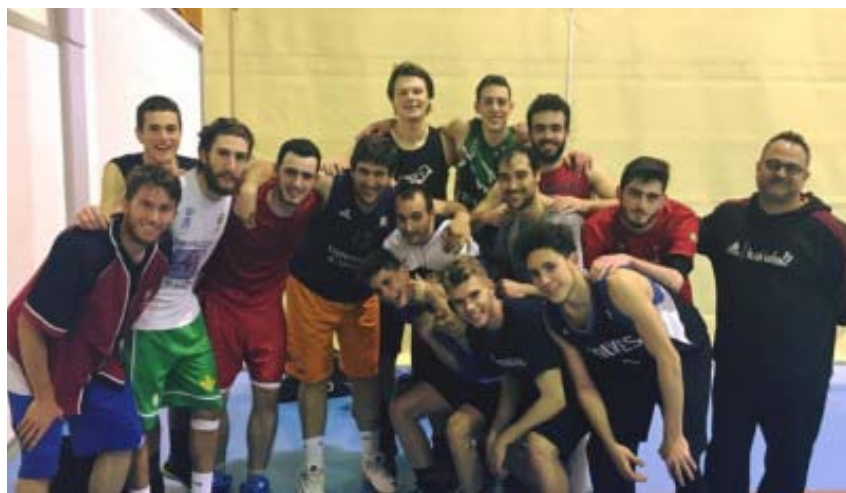
Resumen Temporada - Senior A Autonómico