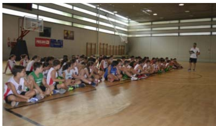
Empezamos el VIII Campus CBI