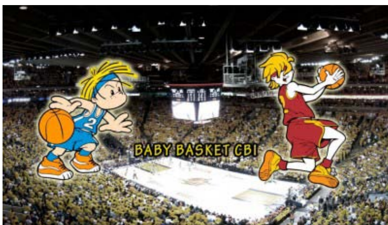
Baby Basket CBI