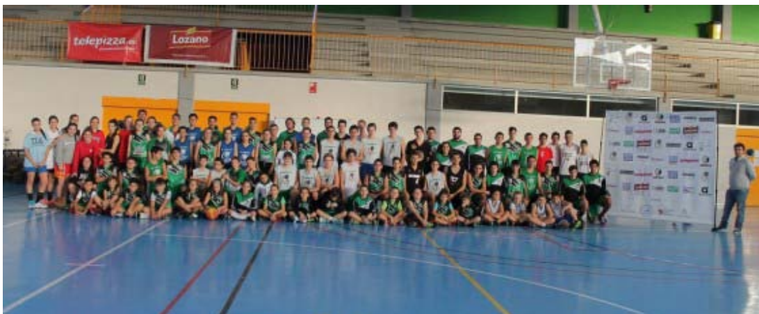
Gran éxito del I Torneo 3x3 CBI

A continuación, mostramos un resumen de noticias de la temporada, algunas de las cuales tuvieron repercusión no sólo en Internet y redes sociales como Facebook o Twitter sino también en medios de comunicación impresos.