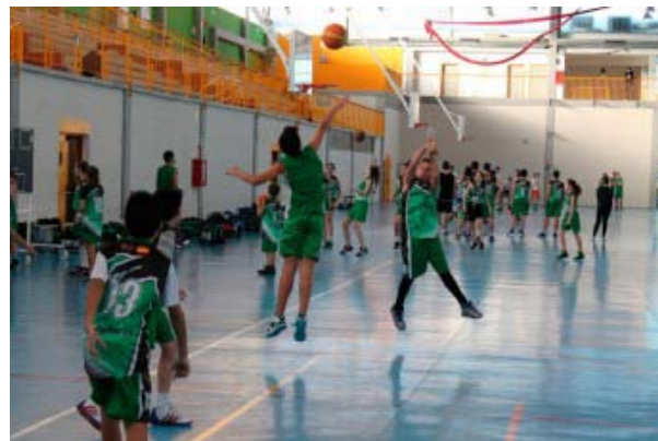
VUELVE EI CIRCUITO 4X4 CBI