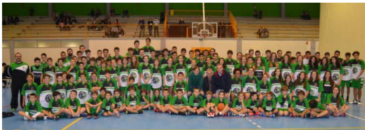
Jornada de presentación del Club Baloncesto Illicitano