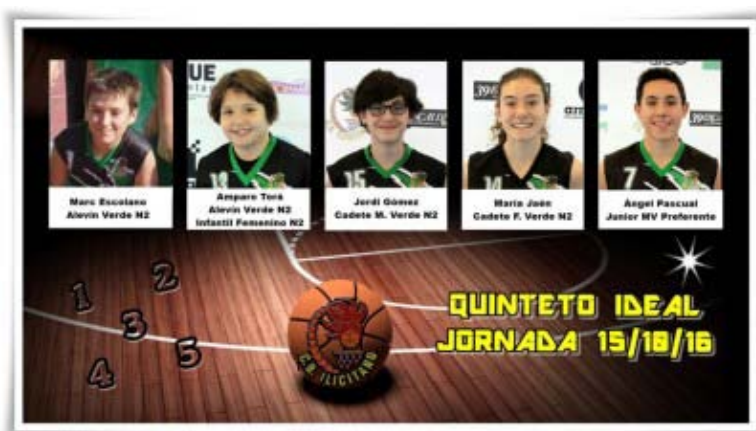
QUINTETO IDEAL CBI - Jornada 15/10/2016