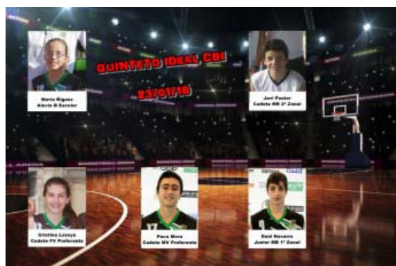
Quinteto Ideal CBI – Jornada 23 Enero