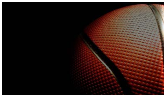
El CBI presente en el VI Torneo Jóvenes Valores