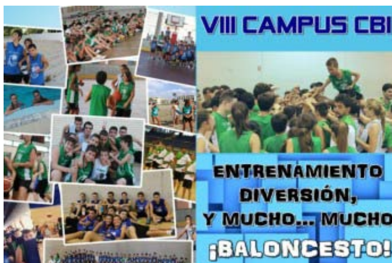
Apúntate ya al VIII Campus CBI