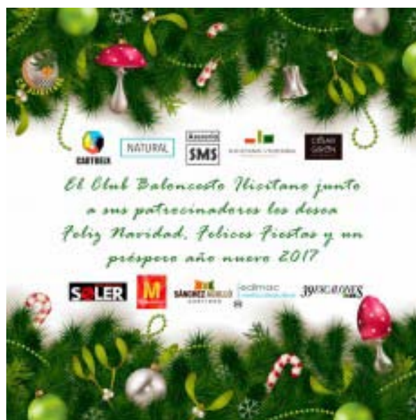
EL CBI les desea Feliz Navidad y Felices...