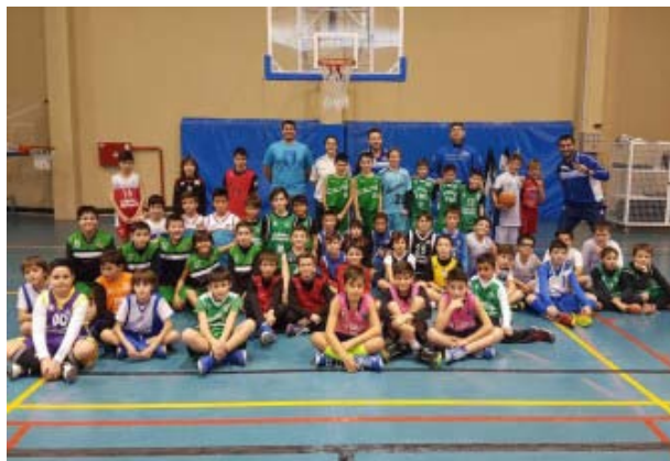
Benjamines en la jornada de detección de la FBCV