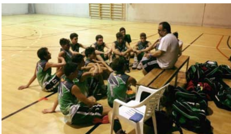
Distribución de Grupos Junior y Senior CBI