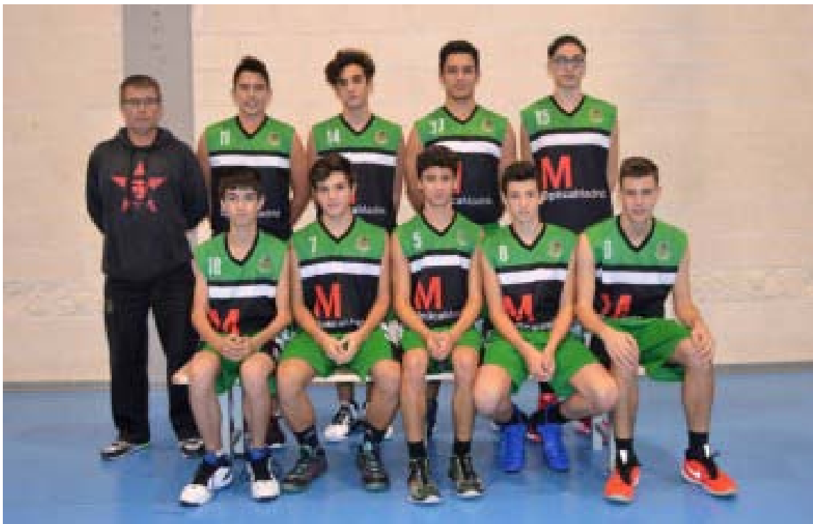
Actividad socioeducativa organizada por la Fundación Real Madrid