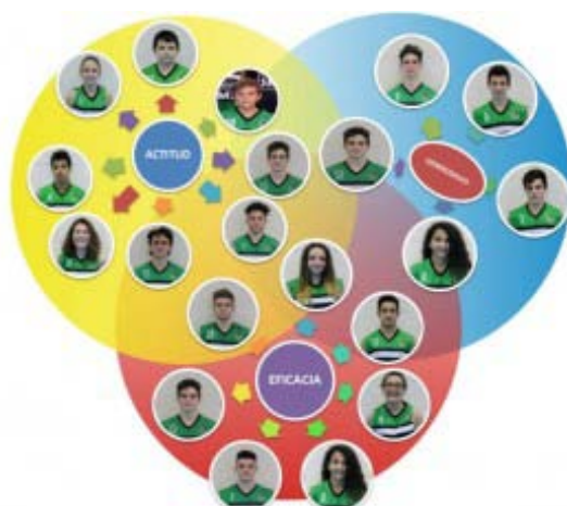
Jugadores + valiosos: Jornada 1/4/17