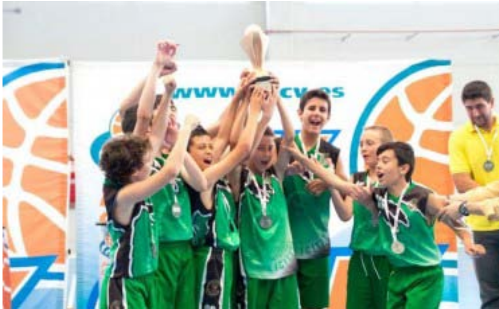
El Alevín Masculino verde Campeón de IR Preferente