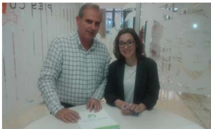
Renovado el acuerdo de colaboración entre la Fundación Juan Perán...