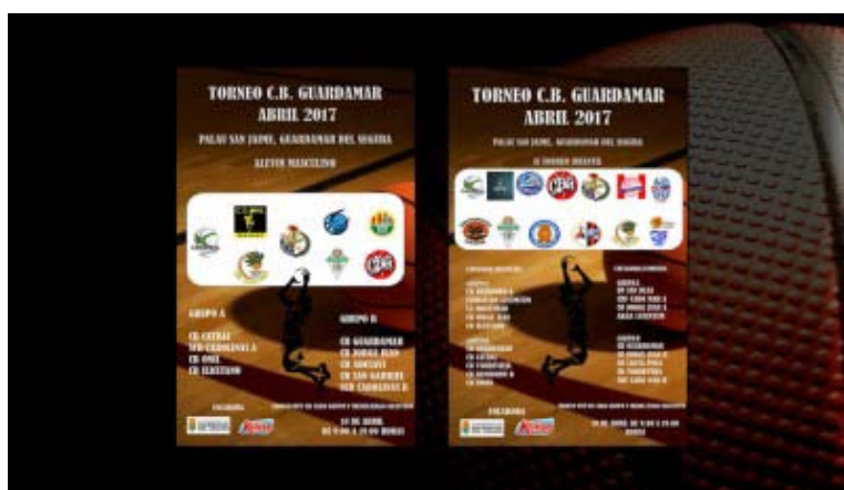
Torneo CB Guardamar Abril 2017