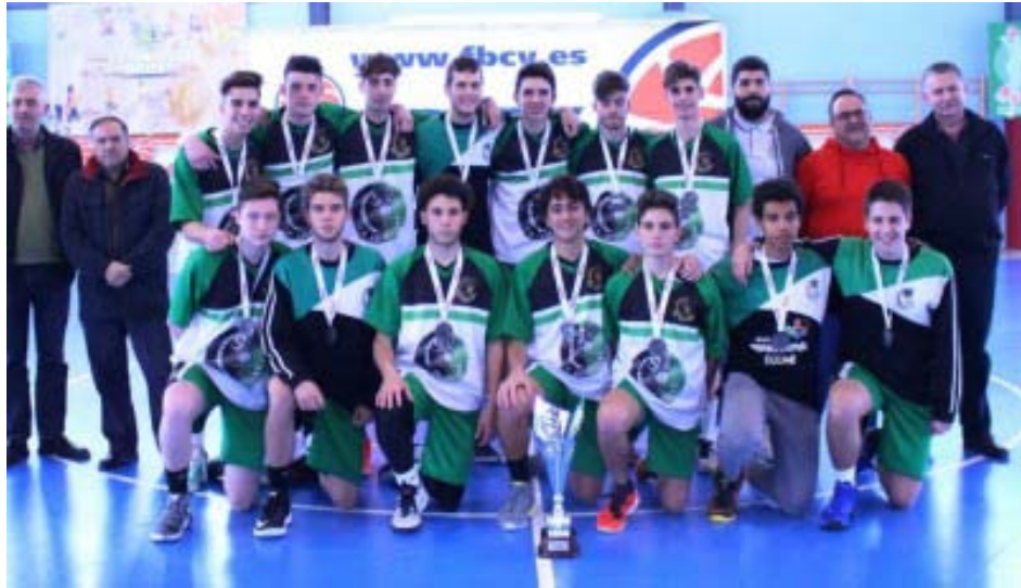
El Junior Masculino Verde Edimac Verticalsolution campeón de la Copa...