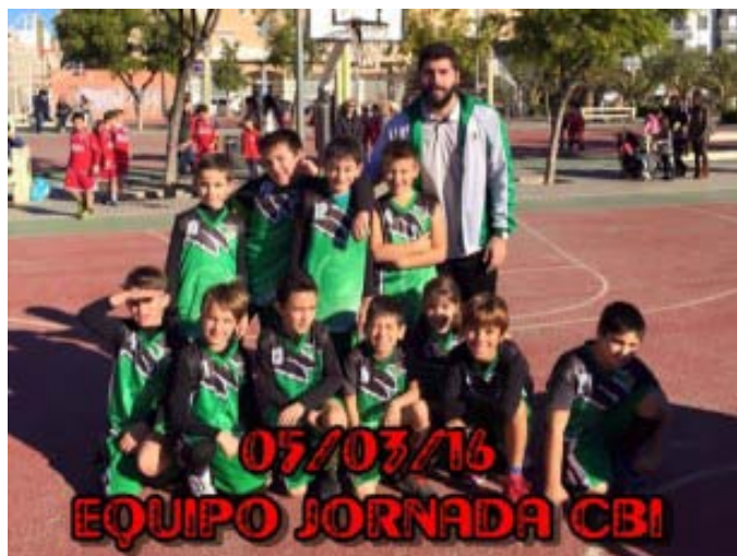
El Benjamín 07 Escolar es el EQUIPO CBI de esta...