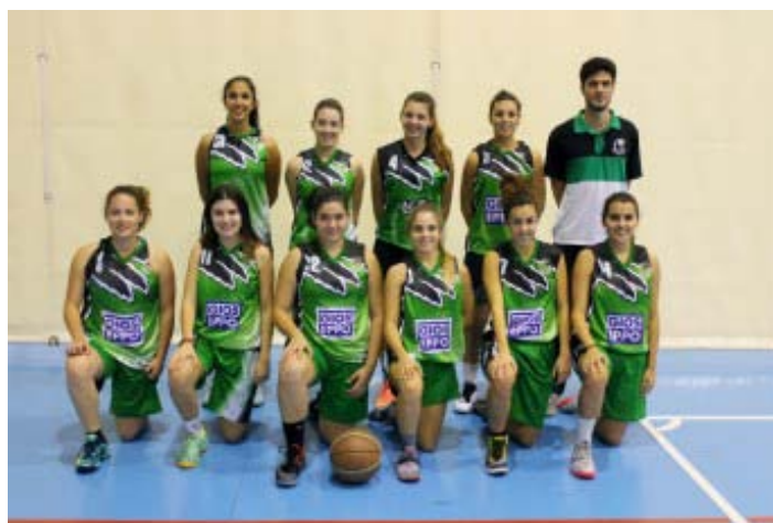
El Senior Femenino Preferente es el EQUIPO...