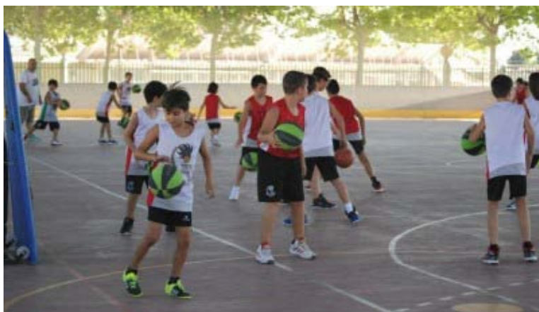
Presentación Escuela Deportiva CBI